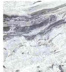
EFFETTO MARMO PER LA PIASTRELLA IN GRÈS PORCELLANATO (MARBLE GRAY, I MARMI DI REX - DA 82,8 EURO AL MQ).