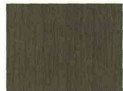
DA SINISTRA, IN SENSO ORARIO: PIASTRELLE RETTANGOLARI (CERIM - 55,44 EURO AL MQ). PORCELLANATO SMALTATO IN SALOTTO (IMOLA CERAMICA - 50,66 EURO AL MQ). A LISTELLI RETTANGOLARI (TREVERK, MARAZZI- 174 EURO AL MQ). DISPONIBILE ANCHE IN GRANDI FORMATI (GEOTECH, FLOOR GRES - 78,48 EURO AL MQ). VISTO DALL'ALTO IL GRÈS PORCELLANATO (TRACCE, FAP CERAMICHE - DA 82 EURO AL MQ).