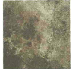
IN GRÈS PORCELLANATO, SI ISPIRA ALLE PIETRE TIPICHE DELLE CAVE VENETE (VELVET, CASA DOLCE CASA - DA 81,6 AL MQ).