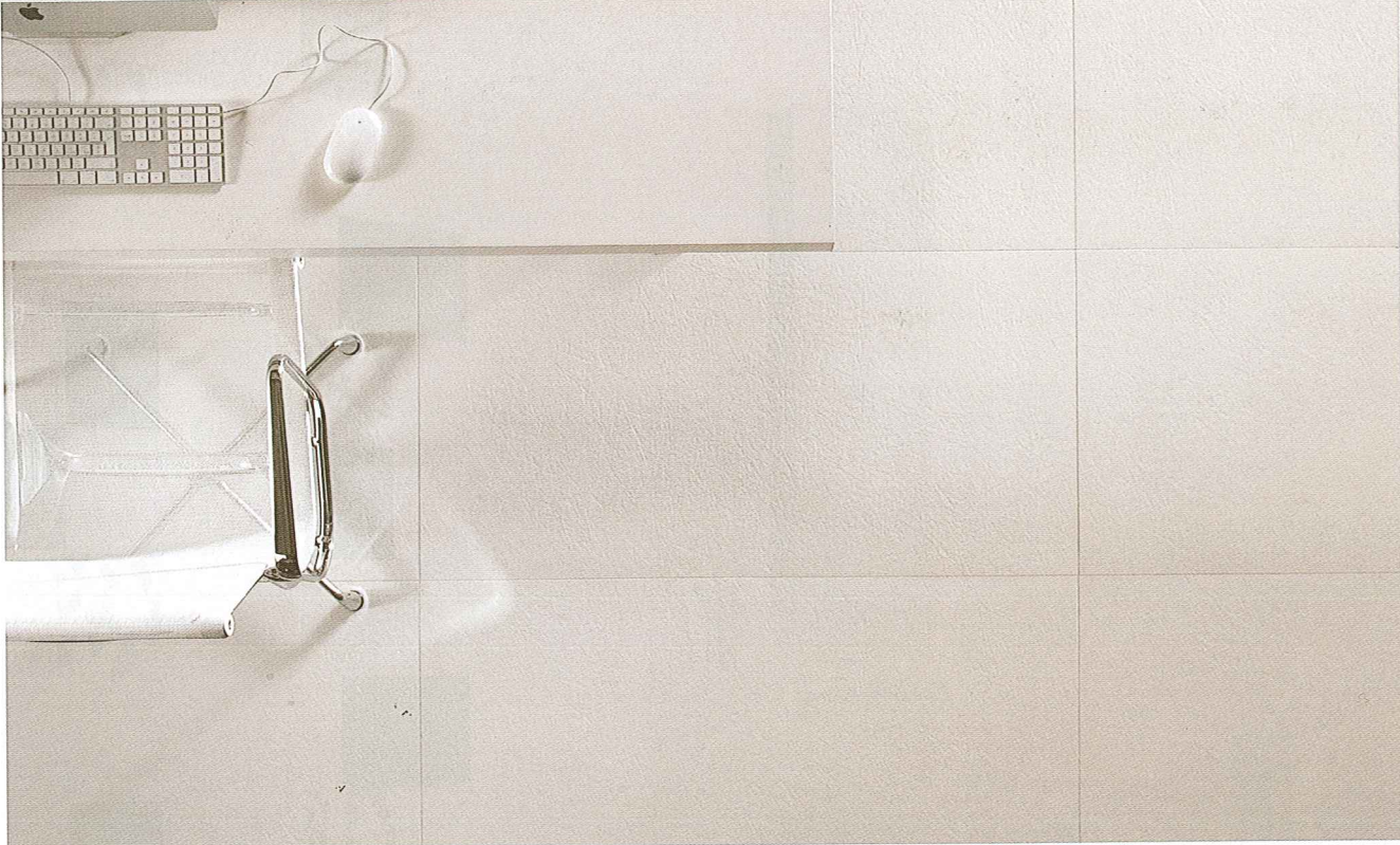
Collezione Less, formato 60x120 cm, finitura carta riso. By Floor Gres.

Quasi un must invece la produzione Antonio Lupi che proprio sul bianco ha fondato buona parte del suo successo. Tra le tante proposte riportiamo i riflettori su Biblio la vasca in Corian disegnata da Nevio Tella-tin. Assolutamente poliedrica, Biblio può essere posizionata sia sul pavimento sia incassata, può essere modellata a ridosso di uno scalino oppure realizzata su misura, anche quando le pareti e la superficie sono fuori squadra. La dimensione dell'invaso rimane in ogni caso invariata.